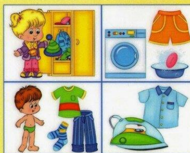
Действия с одеждой